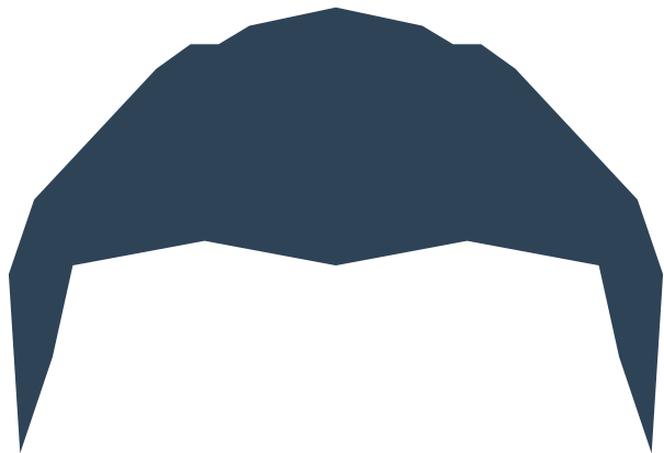
Badi - Matonge